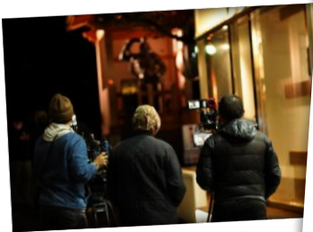
วัดโตโตคุจิ + Restaurant & Bar Beans