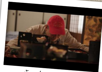
บ้านเก่าตระกูลอิราตะ