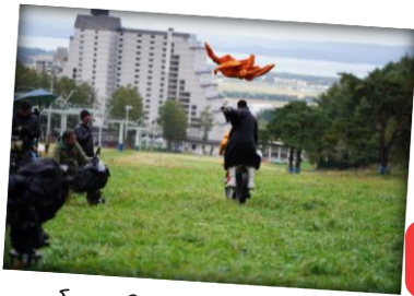
โรงแรมคิซาทะคอินะวะชิโระ

ภาพยนตร์ไทยเรื่อง “แต่ง...Monk” ได้เดินทางไปถ่ายทำที่เมืองไอซึวากามัตสึ จังหวัดฟุกุชิมะ ประเทศญี่ปุ่น ทั้งในสถานที่ท่องเที่ยวอันโด่งดังและสถานที่ลับ ๆ ภายในเมือง ในช่วงฤดูใบไม้ร่วงมีที่ไหนบ้างนั้น...ไปตามรอยกัน!