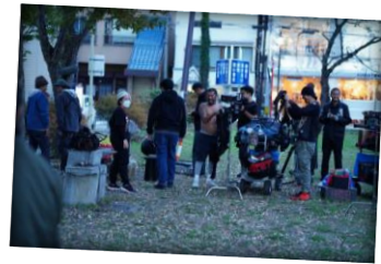
สวนสาธารณะจูโจจิโด