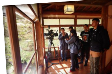
โรงแรมฮิกายามะออนเซ็น มุโตะทาคิ