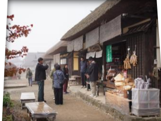
หมู่บ้านโบราณโองุจิจุด